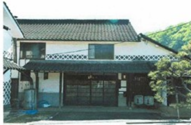
山成酒造店舗兼主屋外観